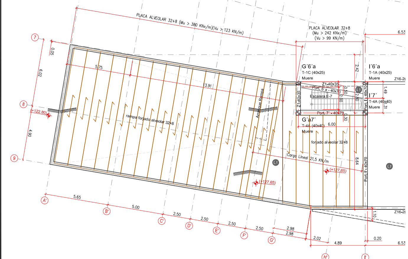
FORJADOS DE PLACA PREFABRICADA PLANTA PCubierta COTA +123.40 Escala A1:1/100 - A3:1/200