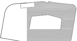
CARACTERÍSTICAS DE LOS MATERIALES EHE-08